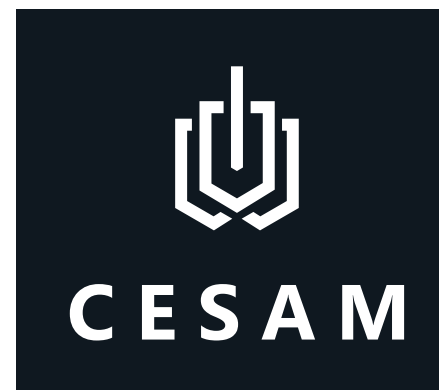
Le logotype en monochrome blanc