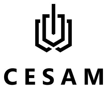
Le logotype en monochrome noir