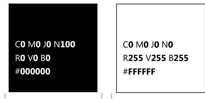
Logo monochrome noir