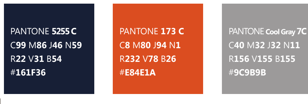
Logo en couleurs