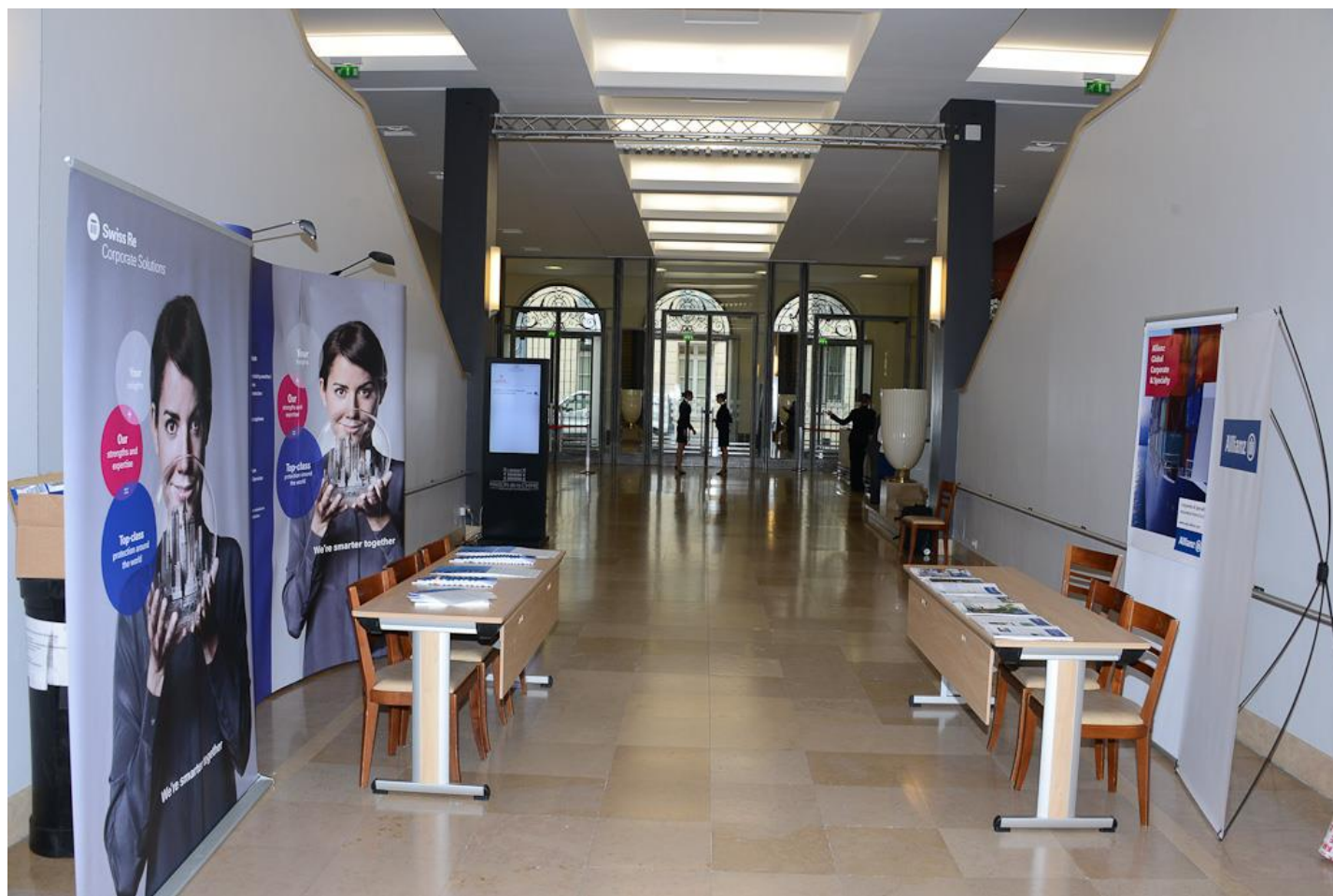
(Le Rendez-Vous de l'Assurance Transports 2015)

L'espace d'exposition est le pivot central et le point de rencontre permanent de votre société lors du Rendez-Vous de l'Assurance Transports